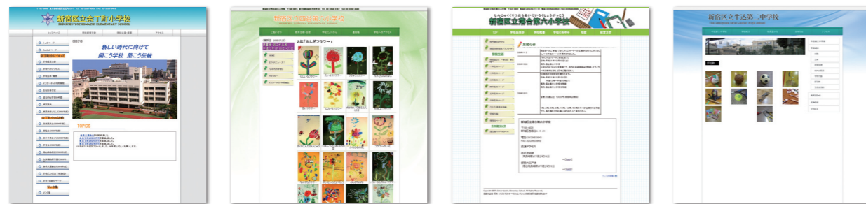
【新宿区立余丁町小学校】 【新宿区立四谷第六小学校】 【新宿区立落合第六小学校】 【新宿区立牛込第二中学校】

tsumiki2.0アカデミック版は現在、新宿区の公立小・中・養護学校(全41校)に導入されています。